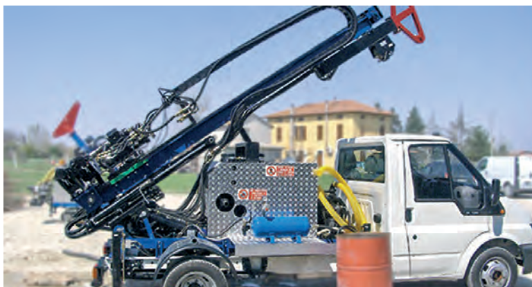
JOY 3 allestita su autocarro / JOY 3 dressed on a truck