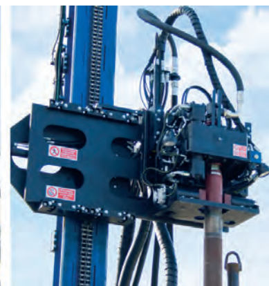
Particolare gruppo testata modello JOY 3 / JOY 3 Sight head set

I dati e le immagini descritte in questo catalogo sono puramente indicativi e Hydra si riserva la possibilità di variarli senza preavviso.